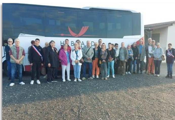
En route pour Saint Emilion !

C'est avec le sourire aux lèvres que nos jeunes et moins jeunes se sont quittés en espérant se revoir pour d'autres moments ensemble.