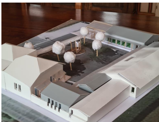
Projet de l'école restructurée

Construire une salle de motricité, un préau et des rangements de cour : La suppression des deux préfabriqués permettrait la création d'une salle de motricité, avec un rangement de cour, un local technique et des sanitaires, dans sa continuité. L'accueil périscolaire serait mutualisé avec cette salle de motricité. Sa conception pourrait permettre sa séparation en deux locaux s'il était nécessaire d'augmenter le nombre de classes. Le préau déborderait sur le trottoir (2,50 m environ) et servirait d'abri aux parents, ou aux enfants attendant le bus.