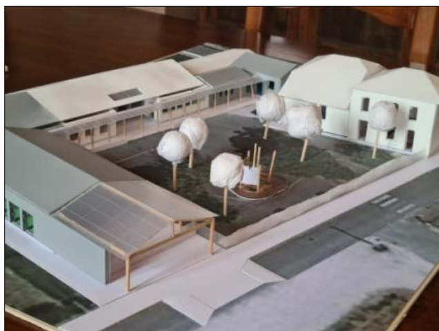
Maquette du projet de l'école restructurée visible aux heures d'ouverture de la mairie